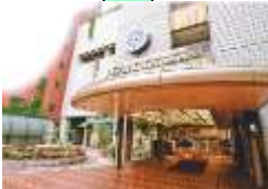
横浜キャメロット・ジャパン